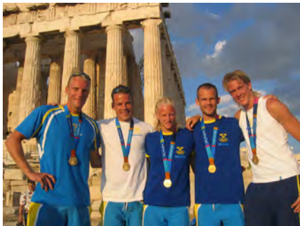
Sveriges guldmedaljörer under OS i Aten 2004.

Olympism är en livsfilosofi som blandar idrott med kultur och utbildning. Idén är att skapa en harmonisk livsstil som bygger på glädjen i att kämpa och utvecklas med respekt för universella fundamentala etiska principer.